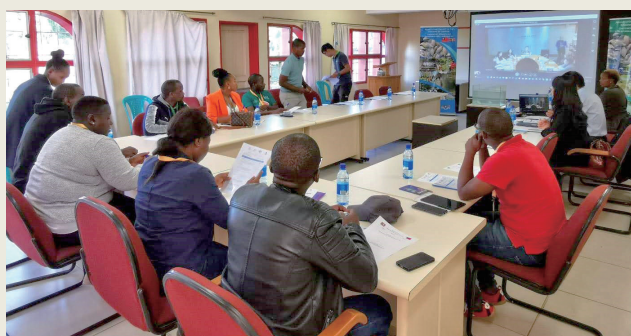
臺史水產養殖技術訓練線上課程