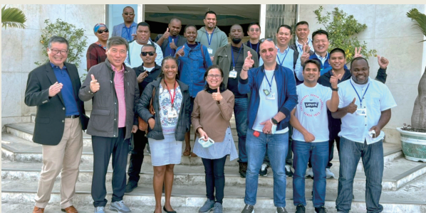
國防大學遠朋國建班一行