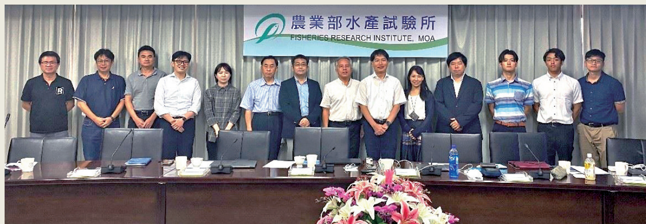
離岸風場與漁業共榮的挑戰與機會工作坊與會人員合影留念