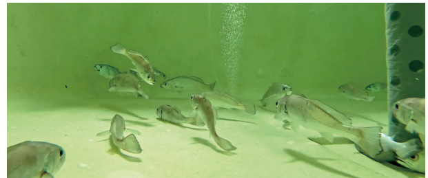
圖 1 釣獲後進行短期蓄養之黑鰔種魚

種魚採集以延繩釣為主，深度 120 – 160 m。由於黑鰔深海上浮造成壓力生理反應強烈，活魚蒐集有其挑戰性。研究建立現場種魚採集流程，釣獲當下活存率僅為總釣獲尾數之 4.16%，小體型個體之釣獲後活存率明顯高於大體型。進港後經短期蓄養 3 週以上 (圖 1)，期間適應陸上養殖而活存之個體比例仍低於總漁獲尾數的 1%，反映深海魚種補充之難度。後續由澎湖以充氧袋空運至高雄，轉陸運方式抵達東港，空運後活存率達 100%，顯示標準化運輸流程具可行性。