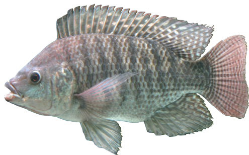
圖 8 臺灣鯛

技術 (Chang et al., 1993, 1996)，這些成果為臺灣鯛奠定了科學養殖的基礎。