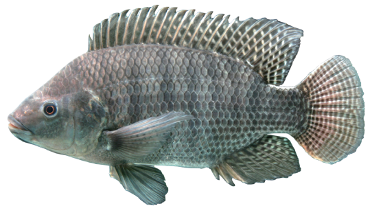
圖4 尼羅吳郭魚