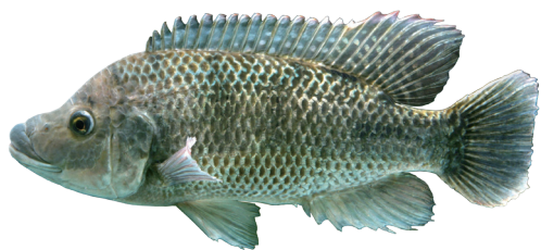
圖 2 莫三比克吳郭魚

莫三比克吳郭魚 (圖 2) 是臺灣水產史上影響最深遠的外來魚種，其引進可回溯至 1946 年，由當時仍具日軍身分的郭啟彰先生與吳振輝先生攜回。郭啟彰先生具備水產養殖專業背景，曾公費赴日本考察，注意到當地吳郭魚以母魚口孵育雛、育成率高，且偏好攝食孑孓 (蚊子幼蟲)，具有防治瘧疾的潛在效益。吳振輝先生早年赴日留學，就讀京都帝國大學農學院經濟部，並曾任職於東北滿州鐵路；二次世界大戰末期被徵召入伍，因而與郭啟彰先生相識。