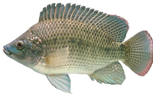
圖 6 福壽魚

的雜交子代。該雜交品系具顯著經濟價值，於 1970 年代正式命名為「福壽魚」(圖 6)，隨後迅速在全臺推廣養殖，對提升養殖產量與改善民生蛋白質供應貢獻良多。