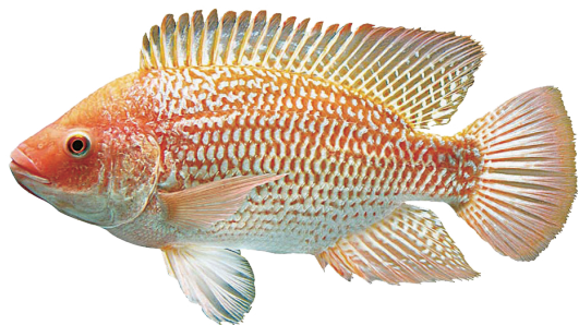
圖 7 紅色吳郭魚 ( Oreochromis spp.)