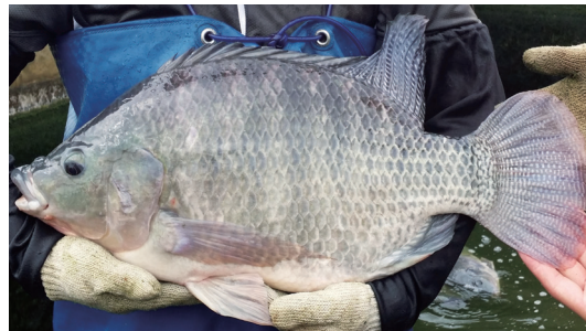
圖 9 超雄性尼羅吳郭魚

(1) 以遺傳育種方法生產單雄性種苗，非透過基因轉殖或基因改造；(2) 其子代為單雄性純種尼羅吳郭魚，而非經由雜交方式獲