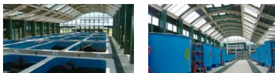
圖 4 設施養殖