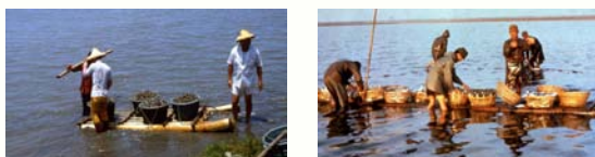
圖3 文蛤養殖(左)與虱目魚養殖(右)